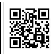
意見調查 QR Code