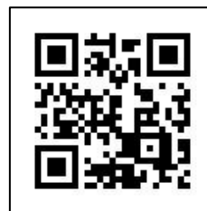
課程教材 QR Code